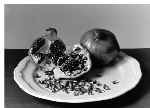
pomegranates 北野 龍一