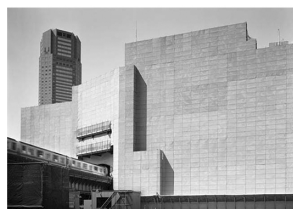
The city & the city 畑 文夫