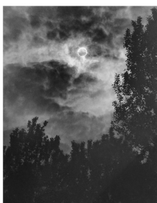
光と影 岡崎 克之