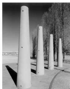
Four pillars 小菅 秀一