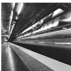
métro Paris 越後 久雄