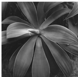
Lion's Tail (Agave attenuata) 臼井 健司