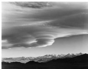
巻雲 中島 秀雄