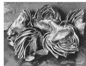
アーティチョーク 浜野 次郎