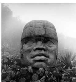
Olmeca Head 川北 弘