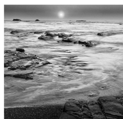
flood tide (上げ潮) 古谷津 純一