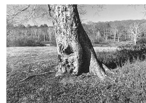
岳樺晩秋 皆川 賢