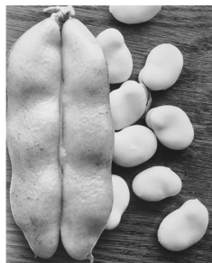
そら豆 金子 正道